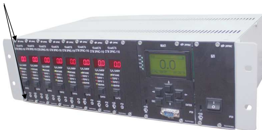
Рис. 1 Система газоаналитическая многофункциональная СГМ ЭРИС-110 (19" слот)