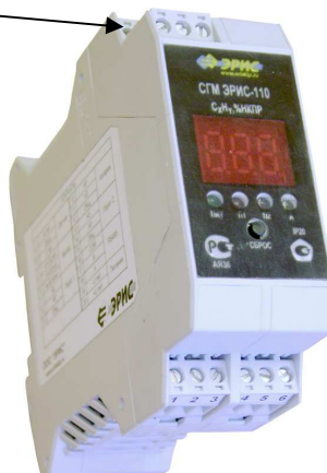
Рис. 2 Система газоаналитическая многофункциональная СГМ ЭРИС-110 (DIN-рейка)