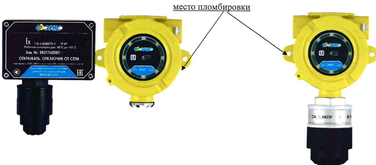
Рисунок 1 – Общий вид датчиков-газоанализаторов ДГС ЭРИС-210-1 с указанием места пломбировки, слева направо: исполнение с выносным чувствительным элементом, моноблочное исполнение

Общий вид датчиков-газоанализаторов ДГС, выносного термокаталитического чувствительного элемента (сенсора) НТ, схемы пломбировки от несанкционированного доступа представлены на рисунках 1-8.