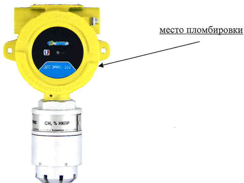
Рисунок 2 – Общий вид датчиков-газоанализаторов ДГС ЭРИС-210-2 с указанием места пломбировки