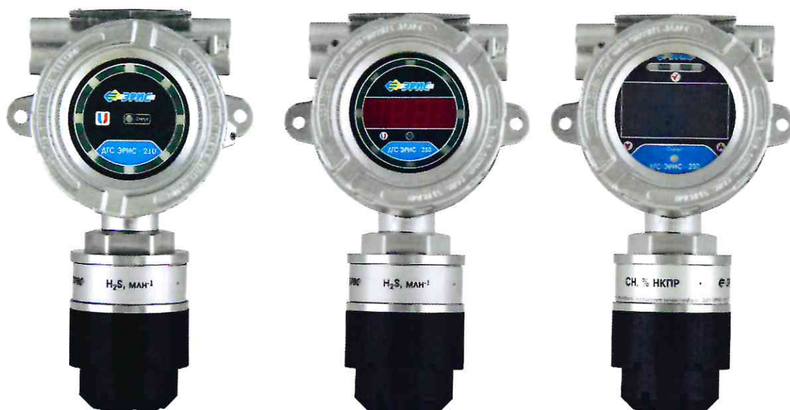
Рисунок 8 - Общий вид датчиков-газоанализаторов в корпусе из нержавеющей стали. Слева направо: ДГС 210-1, ДГС 230-1, ДГС-230-3