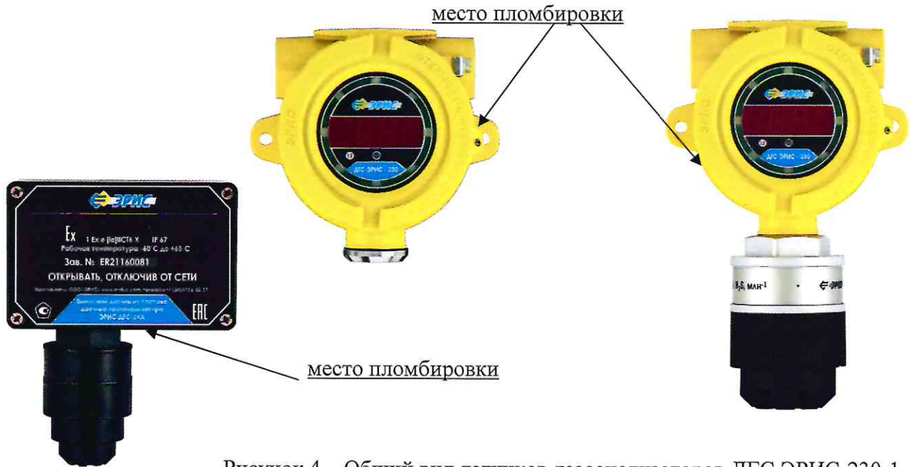
Рисунок 4 – Общий вид датчиков-газоанализаторов ДГС ЭРИС-230-1 с указанием места пломбировки, слева направо: исполнение с выносным чувствительным элементом, моноблочное исполнение