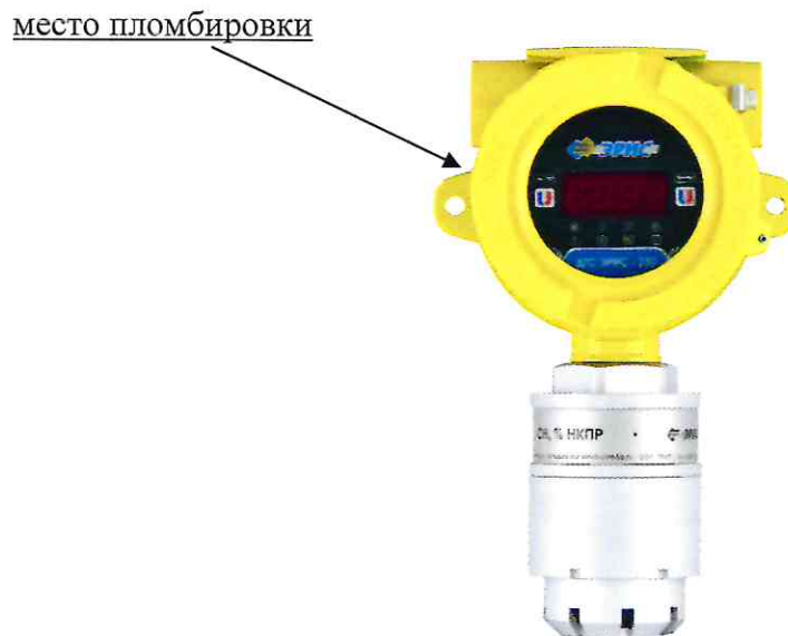
Рисунок 5 – Общий вид датчиков-газоанализаторов ДГС ЭРИС-230-2 с указанием места пломбировки