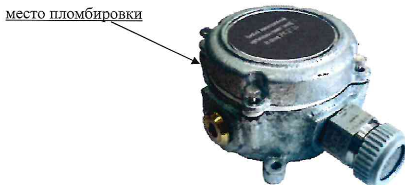
Рисунок 7 – Общий вид выносного термокаталитического чувствительного элемента (сенсора) НТ с указанием места пломбировки