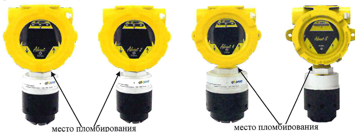
Рисунок 1 – Общий вид газоанализаторов Advant. Слева-направо: Advant, Advant 2, Advant 4, Advant S

Общий вид газоанализаторов, схема пломбировки от несанкционированного доступа представлены на рисунках 1 - 2.